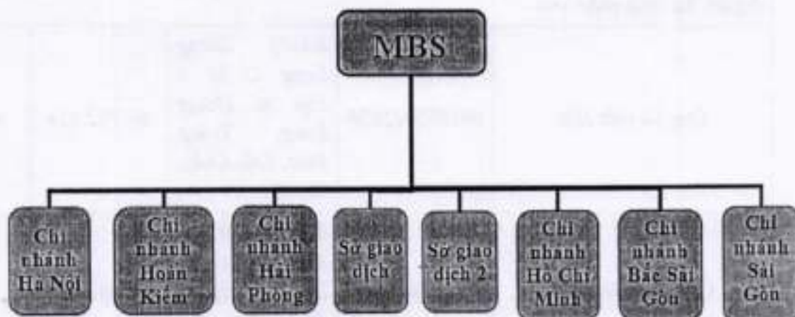
Hình 4: Mạng lưới của công ty.